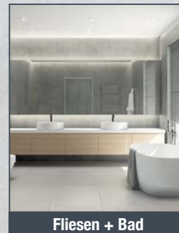
Fliesen + Bad