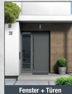
Fenster + Türen